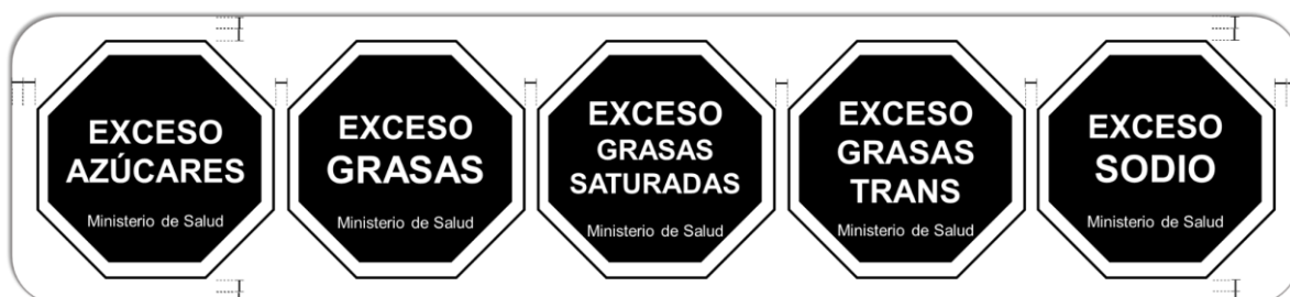
FIGURA 2 a que se refiere el artículo 32, Capítulo II Referente a Etiquetado nutricional de advertencia en la parte frontal del envase (ENAPFE)